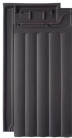
M.30 Antracite TX2