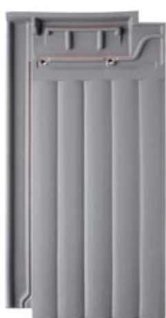
M.31 Cinza Aço TX2