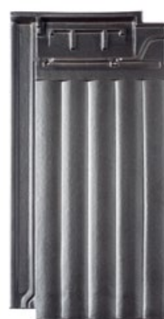
L.38 Cinza Metalizado TX2