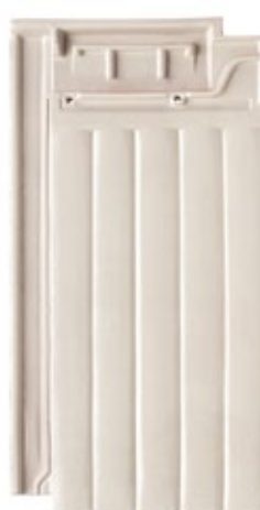
L.33 Branco Pérola TX2