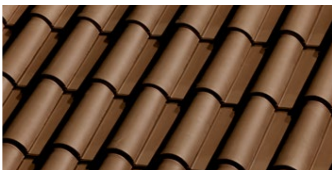
N.04 Castanho Natural