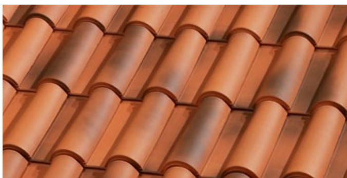
E.40 Natural Rústico