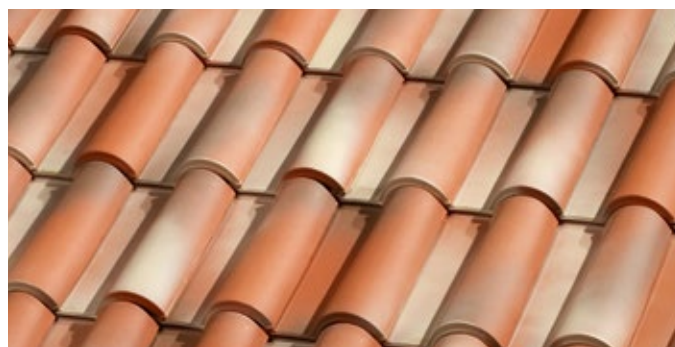
E.41 Mediterrânico Rústico