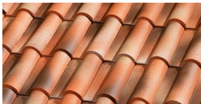
E.47 Rústico Antigo